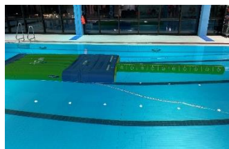
Schwimm- und Badespaß