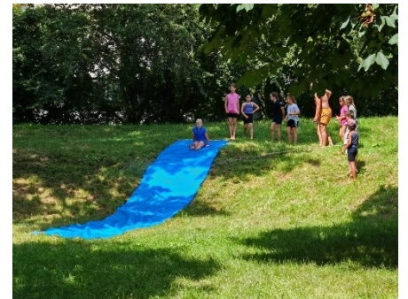
Spaß auf dem Spielplatz