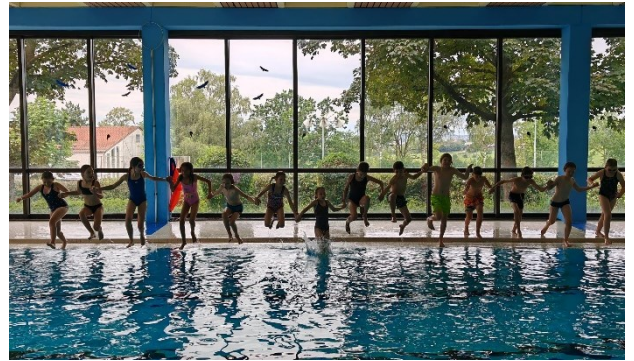
Schwimm- und Badespaß