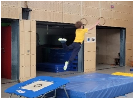
Ninja Warrior Parcours und Parkour/Slackline